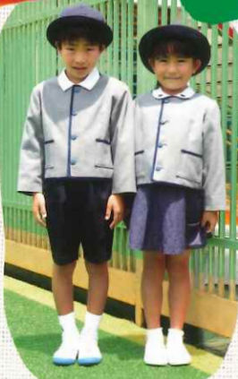
プレザーと冬季制帽